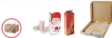
Emballages en papier et carton