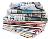
Journaux et magazines